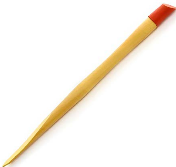
Fig. 5 Le pied-de-biche bois

Figure 4 : Le bâtonnet de buis parfait le démaquillage des ongles et sert pour le travail des cuticules.