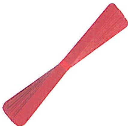
Fig. 3 Limes rouges émerisées

Figure 3 : La lime à ongles cartonnée possède deux faces :