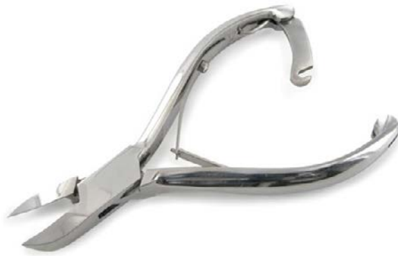
Fig. 1 Pince à ongles

1. Pour chaque image suivante, indiquez le nom de l'instrument et sa fonction.