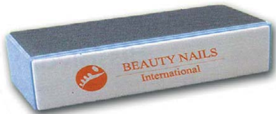
Fig. 6 Polissoir 4 en 1 (bloc bleu)

Figure 6 : Le polissoir sert à faire briller les ongles et à retirer les aspérités.