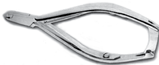
Fig. 2 Pincettes à ongles

Figure 2 : La pince à ongles coupe les petites peaux formées sur le pourtour de l'ongle.