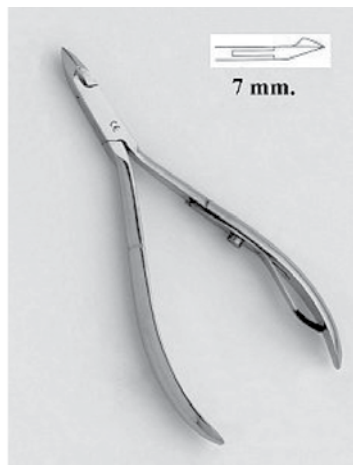
Figure 1 : La pince à ongles métallique permet de raccourcir l'ongle à la longueur désirée.