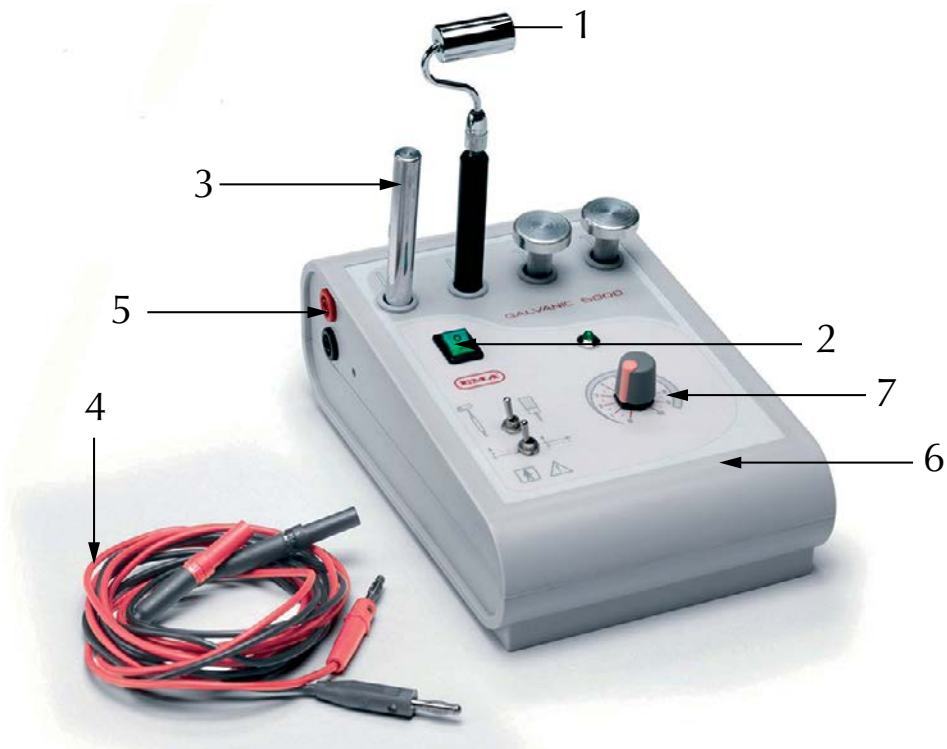
Fig.1 Appareil à ionophorèse

1. Quel est le nom de l'appareil ci-dessous ? (1 point)