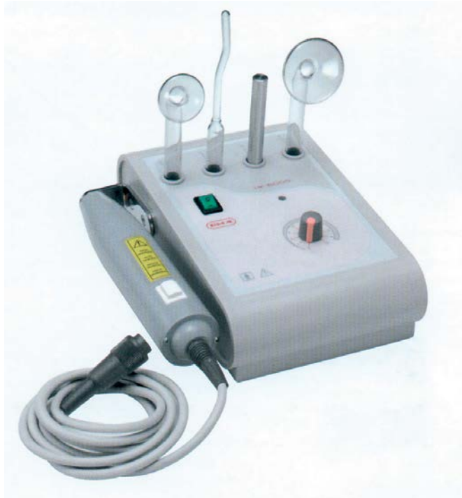
Fig.2 Appareil à haute fréquence

2. Pour chaque type de peau, indiquez les types d'électrodes à utiliser, le mode d'application et la place dans le soin. (2 points)