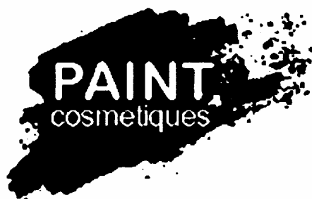
Logo superposant texte et dessin