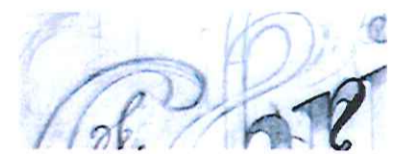
Exemple croquis ( calligraphie )