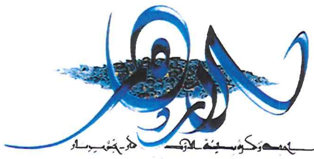
Calligraphie arabe H. Massoudy et S. Al-Moussawy