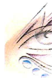
Exemple croquis ( œil et motif sur un autre thème )