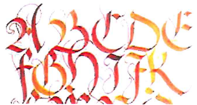
Calligraphie latine Shita S. Zenker

Les formes, les couleurs ont leurs existences propres au sein de chaque culture mais elles n'en restent pas là car au-delà des frontières elles se mélangent, s'interpénètrent. Elles sont universelles.