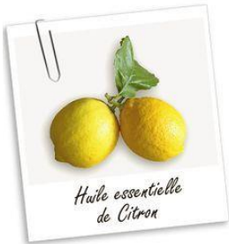
Huile essentielle de Citron