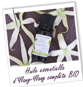
Huile essentielle d'Ylang-Ylang complète BIO