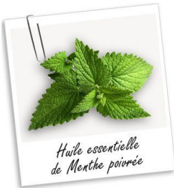
Huile essentielle de Menthe poivrée