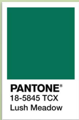
PANTONE® 18-5845 TCX Lush Meadow