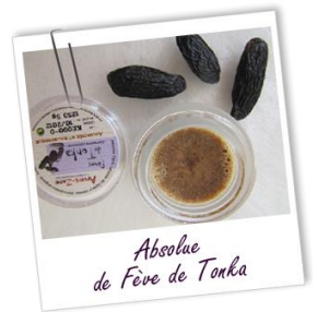
Absolute de Fève de Tonka