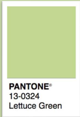
PANTONE® 13-0324 Lettuce Green