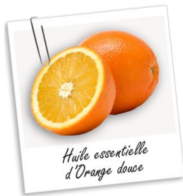
Huile essentielle d'Orange douce