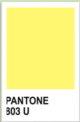
PANTONE 803 U