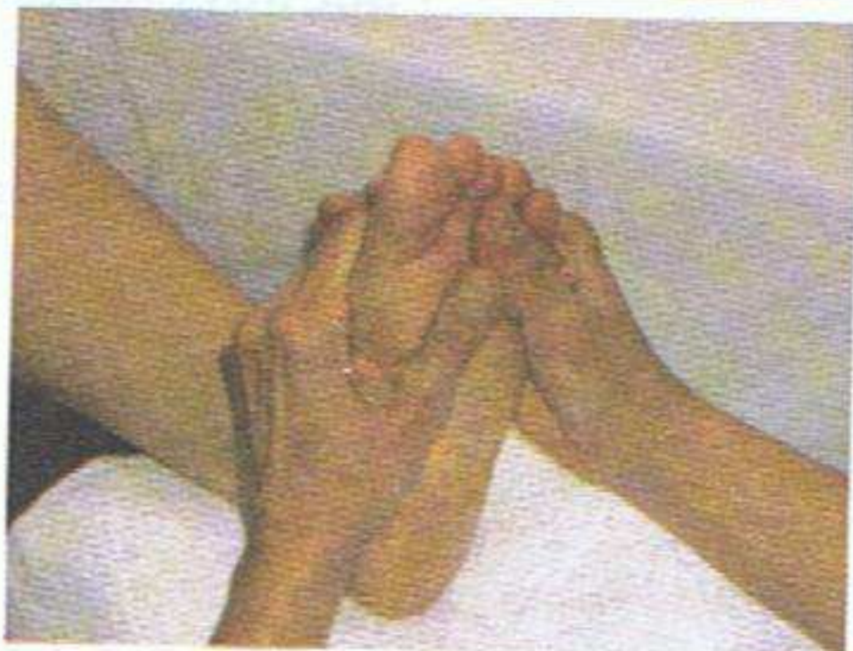
Éventail sur la plante des pieds