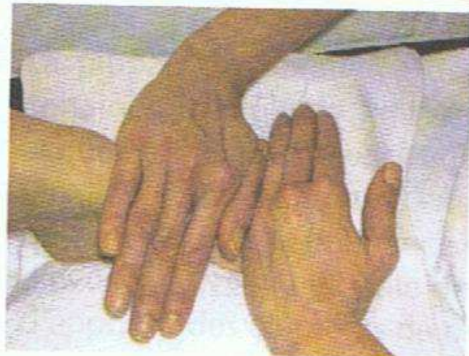
Effleurage du dessus du pied