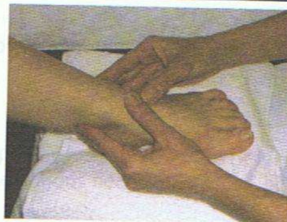
Effleurage des malléoles interne et externe