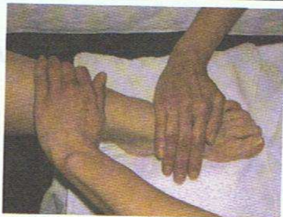
Effleurage du pied et de la jambe