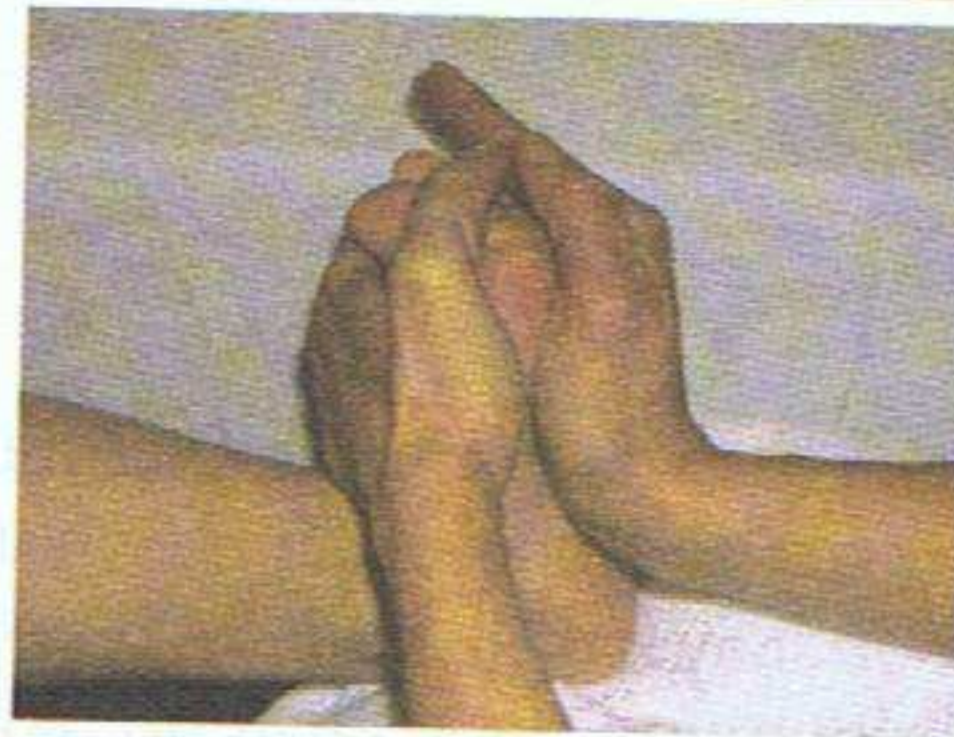
Modelage énergétique de la plante du pied