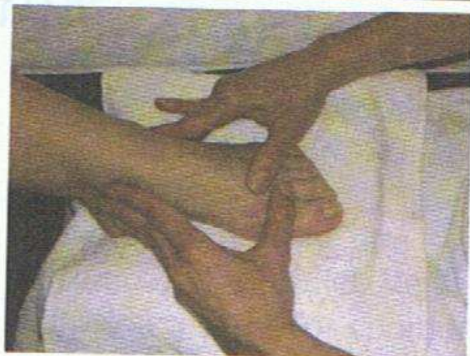
Effleurage des espaces inter-métatarsiens