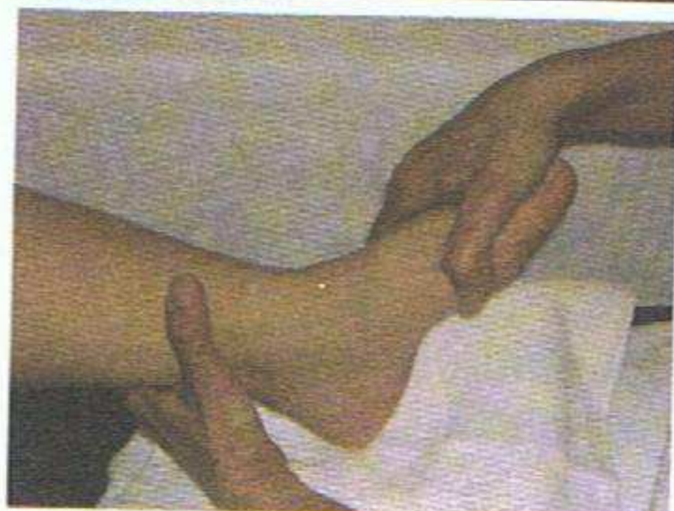
Mobilisation de la cheville