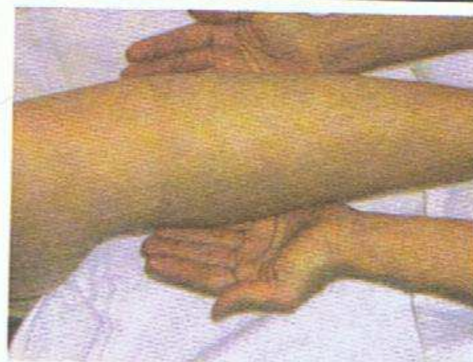
Battages et pétrissages du mollet