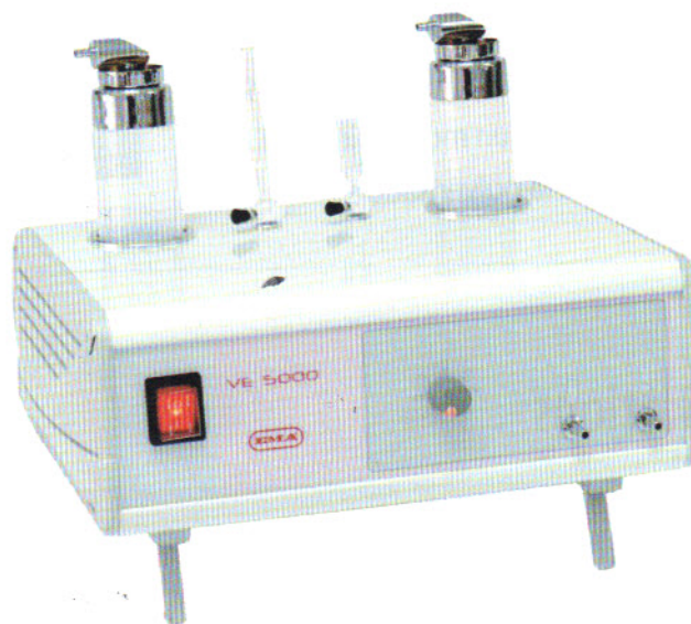
Appareil à deux fonctions : Aspiration et pulvérisation